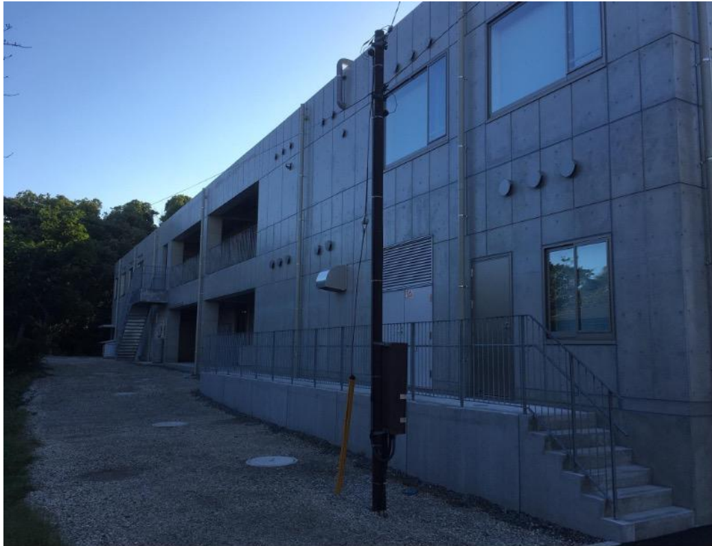
教育棟の正面玄関反対側。 奥の階段の下のあたりに、実習室への裏口があります。