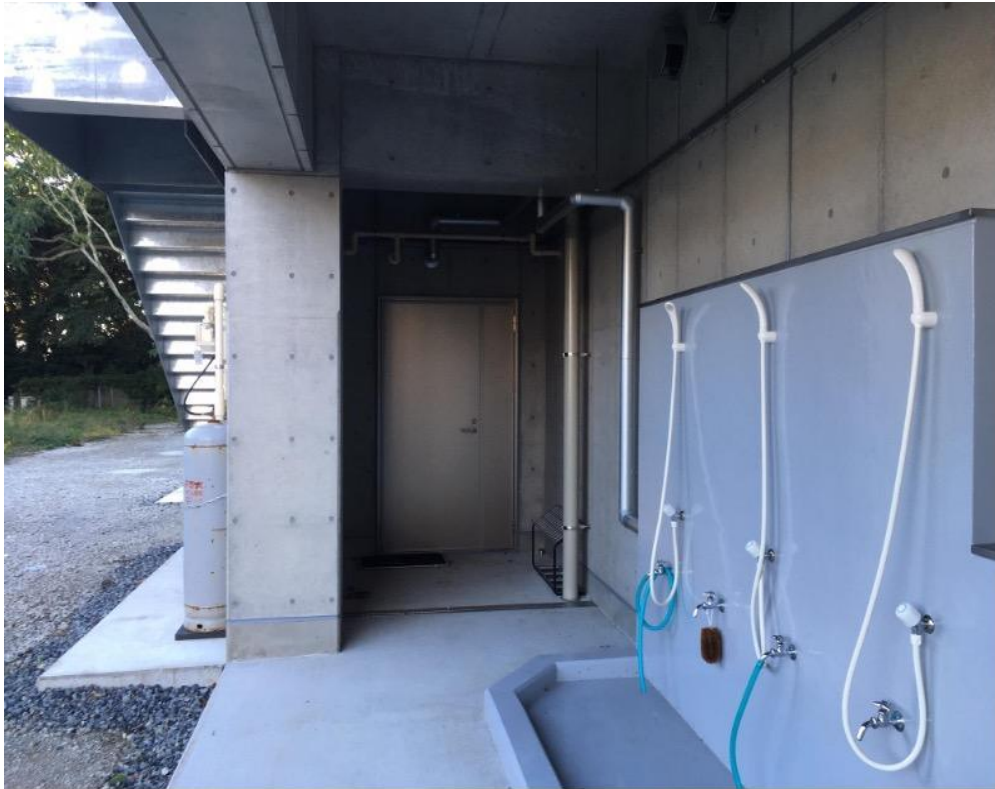
シャワーの横のこの扉が実習室への入り口です。 実習中はこちらを通るようにしてください。