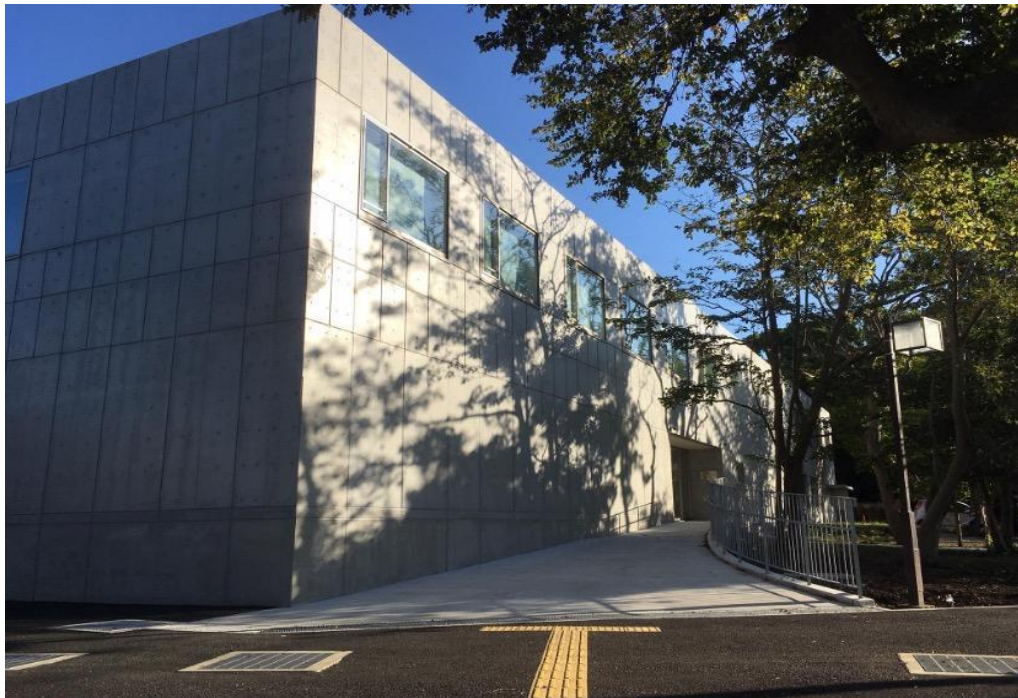
正門からみた教育棟の正面玄関に続く道